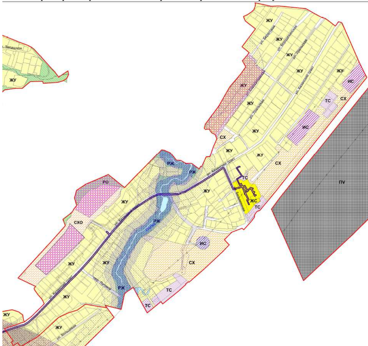
Рис.2 Фрагмент карты градостроительного зонирования

Фрагмент карты градостроительного зонирования представлен на рисунке 2.